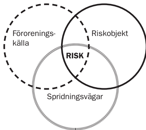
Figur 3. Illustration av miljö/hälsorisken av ett kulfång.

Negativ påverkan av en förorening i mark eller vatten kan enbart ske om föroreningen överstiger en viss halt, det finns ett riskobjekt samt en exponeringsväg mellan föroreningen och riskobjektet. Med andra ord, enbart förekomsten av en förorening innebär inte automatiskt en risk för påverkan. Detta har exemplifierats i Figur 3.