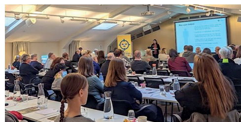
Bild från Årets Skytteforum som hölls i Bromma, Stockholm

Under året 2021 fanns det unga representanter i förbundsstyrelsen och i sektionerna; gevär, lerduva, pistol och viltmål. Efter två år av pandemi var det roligt och givande att träffa såväl nya som gamla ansikten under Skytteforum i november 2021. 14 ungdomar från olika delar av landet träffades och hade möjligheten att diskutera forumets frågor och ge ett ungdomsperspektiv. Ungdomarna kunde byta idéer och tankar med varandra för att lyfta såväl positiva delar, som utmaningar med att vara aktiv ungdom inom skyttesporten. Det fanns stor igenkänning och man kunde finna stöd i varandras erfarenheter mellan de olika sektionerna. Det här ger förhoppningar om ett tätare samarbete mellan ungdomarna i sektionerna inför år 2022.