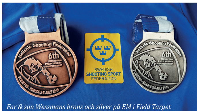
Far & son Wessmans brons och silver på EM i Field Target

Vi har varit bortskämda med medaljer på VM i FITASC Sporting men tyvärr blev vi utan medalj denna gång.