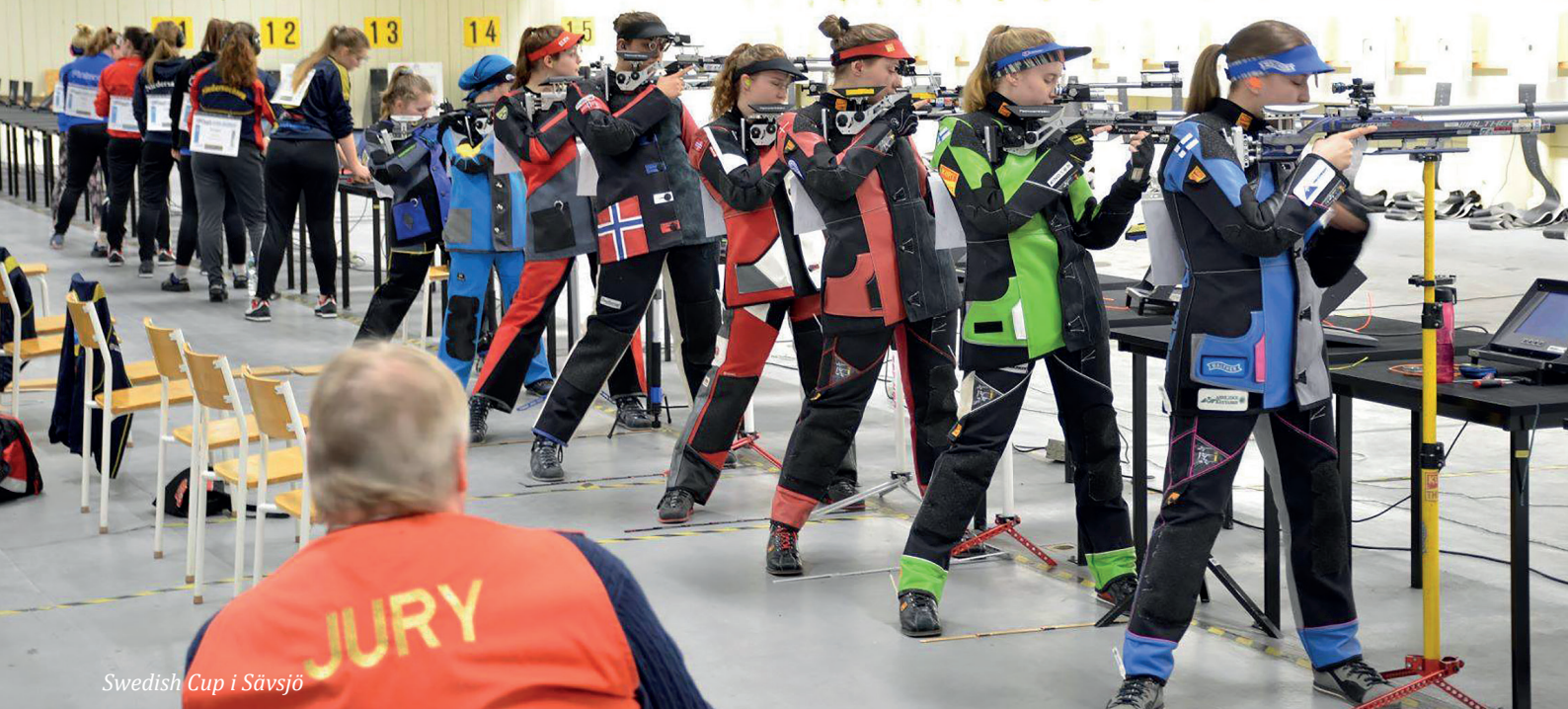
Swedish Cup i Sävsjö

Tävlingen är viktig för svenska skyttar, men också våra nordiska grannar poängterar att det är en viktig värdemätare och en viktig mötesplats.