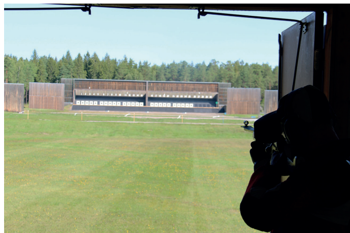
300 meterskytte, Livgardet.

Till sist ett stort tack till alla ideella krafter i föreningar och distrikt som bär vårt skytte framåt. Alla resultat hittar du i Gevärss sektionens speciella resultatbilaga.