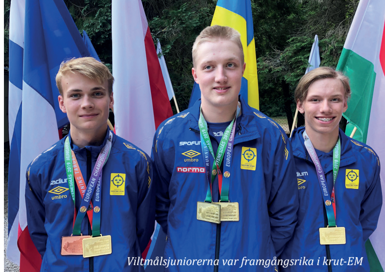
Viltmålsjuniörerna var framgångsrika i krut-EM