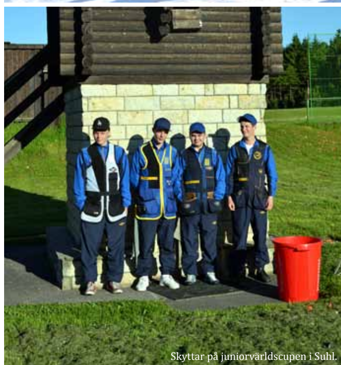
Skyttar på juniorvärldscupen i Suhl.