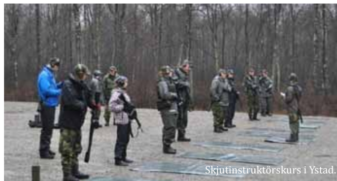
Skjutinstruktörskurs i Ystad.

Verksamhetsplanen på Aleholmsskolan har uppdaterats i samverkan med skolans instruktörer och rektor. SvSF har även haft regelbundna möten med företrädare för skolan, kommunen och elever (den så kallade RIG-gruppen) för att kvalitetssäkra undervisning, träning och elevernas