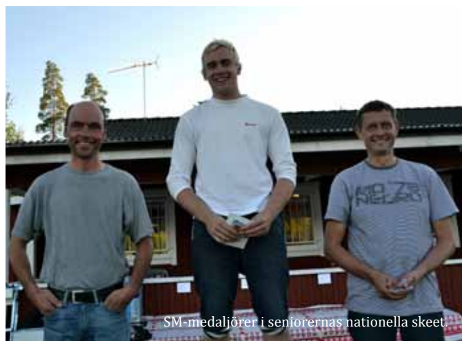
SM-medaljörer i seniorernas nationella skeet.