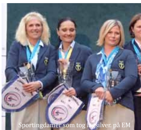
Sportingdamer som tog lag-silver, på EM