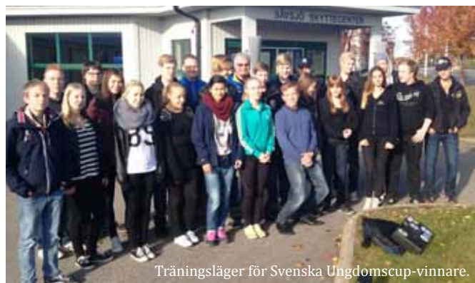
Träningsläger för Svenska Ungdomscup-vinnare.