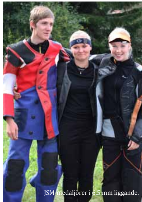
JSM-medaljörer i 6,5 mm liggande.