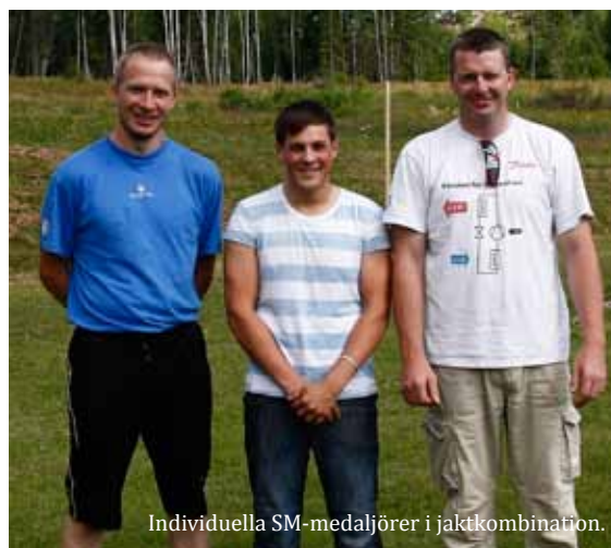
Individuella SM-medaljörer i jaktkombination.