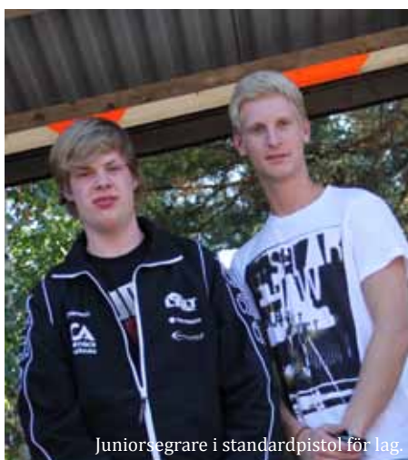
Juniorsegrare i standardpistol för lag.