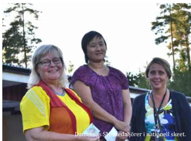
Damernas SM-medaljörer i nationell skeet.