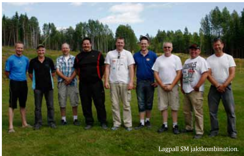
Lagpall SM jaktkombination.