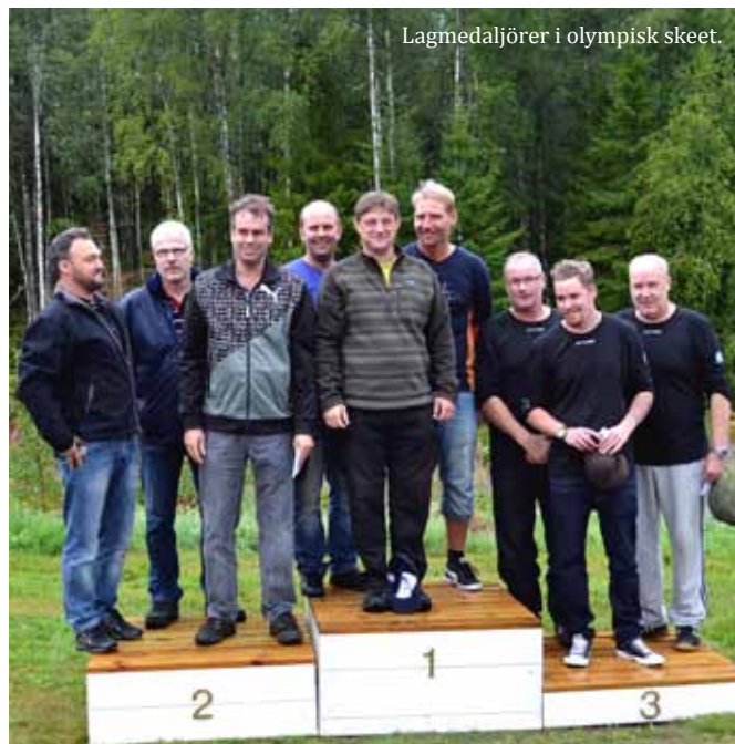
Lagmedaljörer i olympisk skeet.