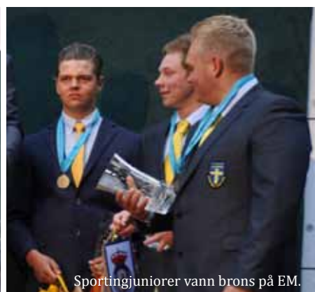
Sportingjuniorer vann brons på EM.