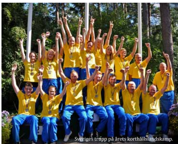
Sveriges trupp på årets korthållslandskamp.