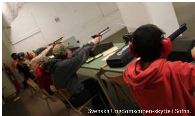
Svenska Ungdomscupen-skytte i Solna.

Sektionen arbetar för att skapa en organisation och ett arbetssätt (implementera träningsplanering och uppföljning) som kan ge skyttar som har viljan, förutsättningarna och arbetssätt att satsa för att nå internationell nivå (GP, landskamper och EC-tävlingar). Kansliet ansvarar för elit-tävlingar som OS, VM, EM och världscuper och där ställs högre krav och tuffare prioriteringar. Man satsar mer på