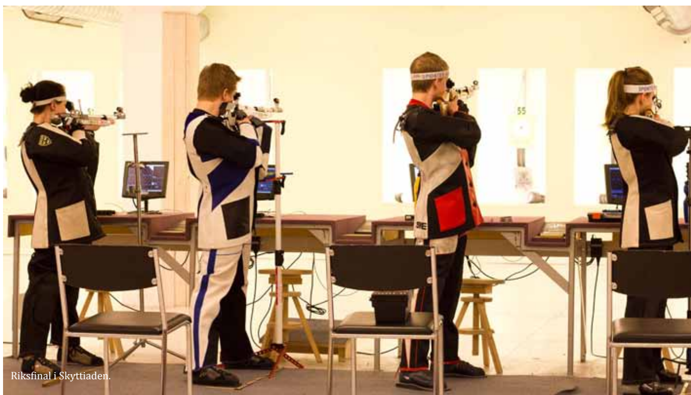
Riksfinal i Skyttiaden.