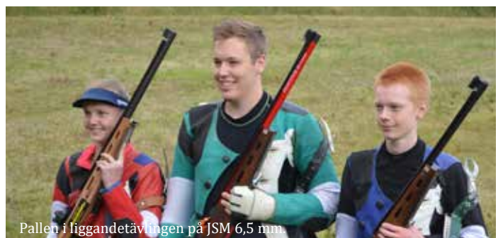
Pallen i liggandetävlingen på JSM 6,5 mm.