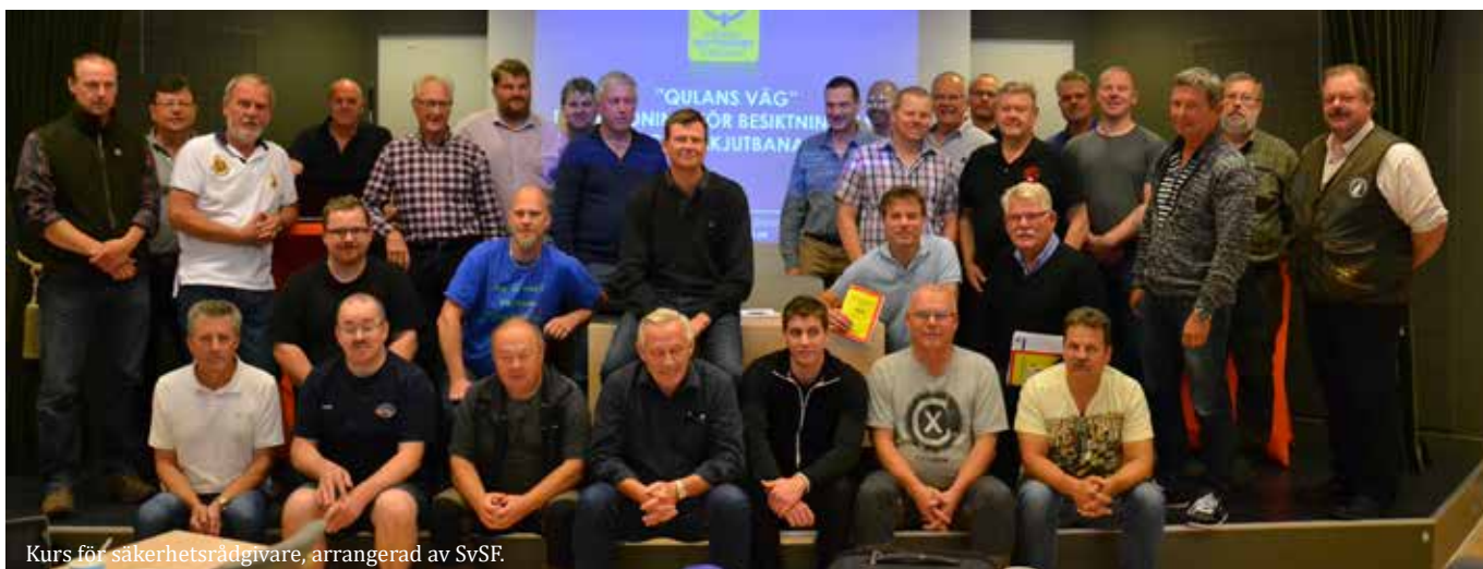
Kurs för säkerhetsrådgivare, arrangerad av SvSF.

Under 2015 fick även SvSF ett bidrag från Kronprinsessan Margaretas Landstormsfond. Totalt fick förbundet 200 000 kronor, varav 40 000 kronor gick till utrustning till Riksidrottsgymnasiet och 160 000 kronor till föreningsträffar i våra distrikt. 2015 besöktes tre av våra distrikt, Dalarna, Östergötland och Stockholm. Till föreningsträffarna bjuds både distriktets föreningar och distriktets styrelse in. Halva träffen avsätts till grupparbeten där deltagarna får arbeta med ämnen som verksamheten och kontakten inom distriktet, men även diskutera kring föreningarnas egen verksamhet. Resterande tid av träffen äg-