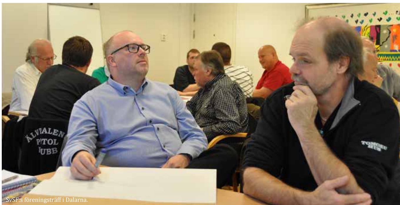
SvSF:s föreningsträff i Dalarna.