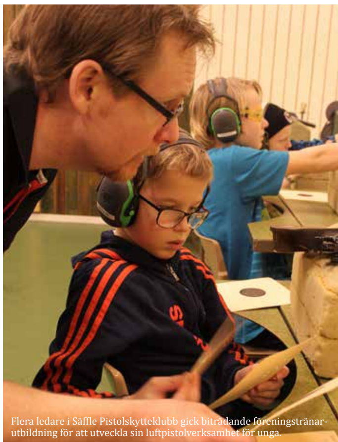
Flera ledare i Säffle Pistolskytteklubb gick biträdande föreningstränarutbildning för att utveckla sin luftpistolverksamhet för unga.