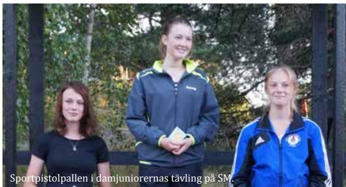
Sportpistolpallen i damjuniorernas tävling på SM.