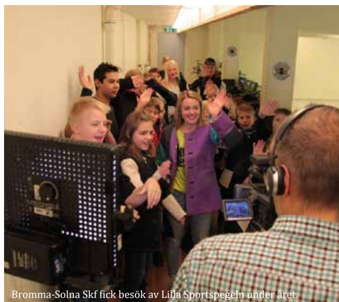
Bromma-Solna Skf fick besök av Lilla Sportspegeln under året.

Vi fortsätter att brottas med att få någon större uppmärksamhet och ett intresse från de rikstäckande medierna, både vad gäller rapportering kring internationella framgångar och i fråga om att uppmärksamma sporten och dess aktiva i reportageform.