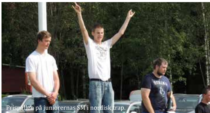
Prispallen på juniorernas SM i nordisk trap.