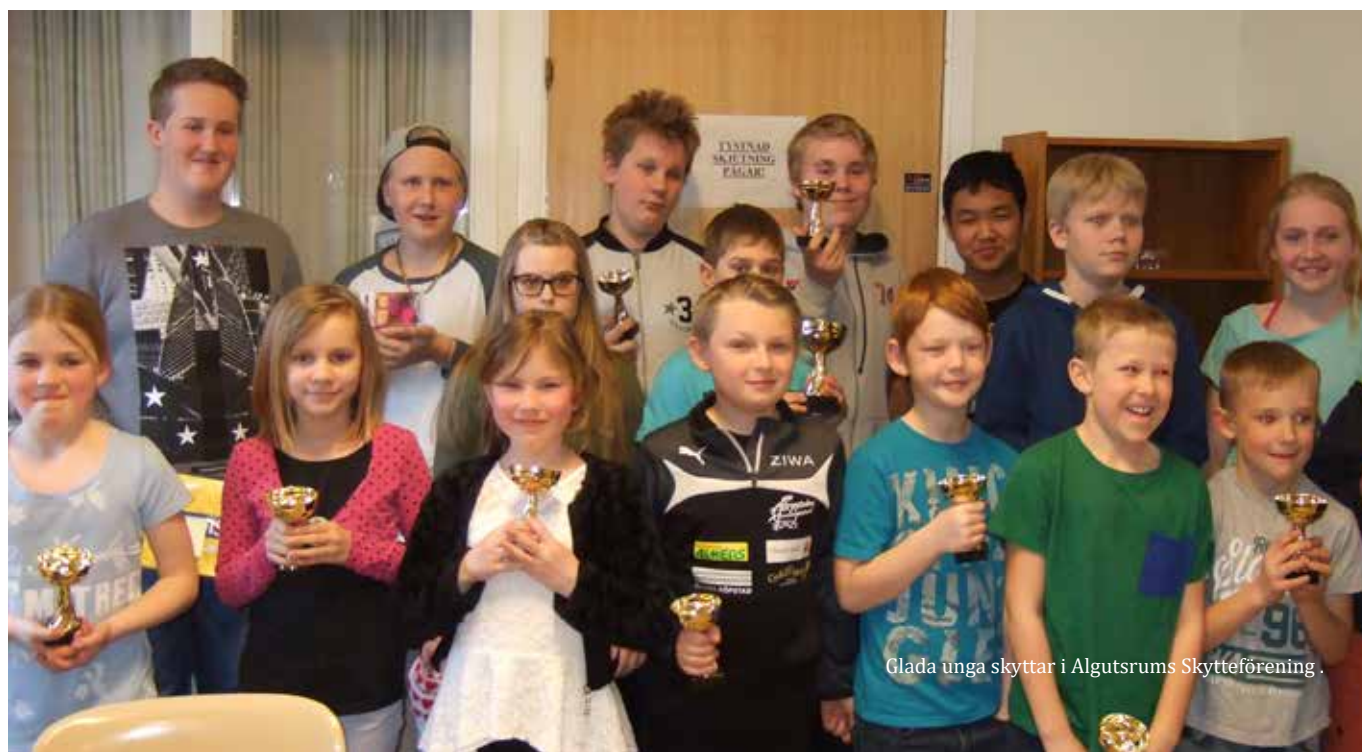
Glada unga skyttar i Algutsums Skytteförening.