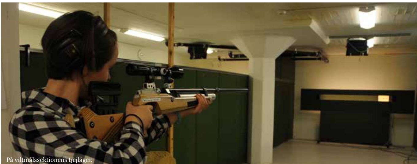
På viltmålssektionens tjejläger.