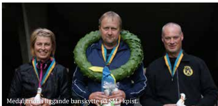
Medaljtrion i liggande banskytte på SM i kpist.