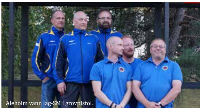
Aleholm vann lag-SM i grovpistol.