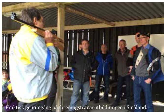
Praktisk genomgång på föreningstränarutbildningen i Småland.