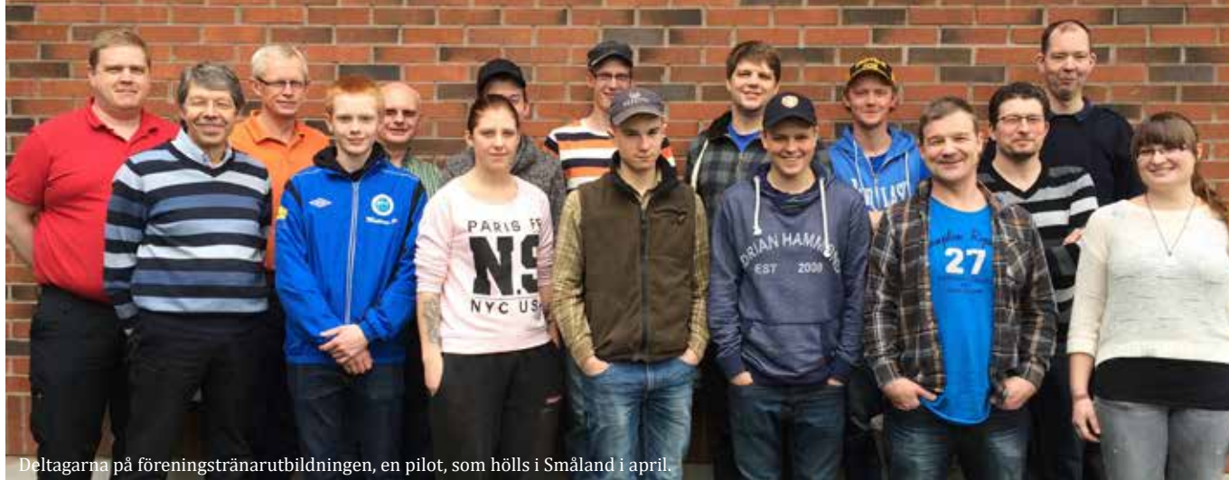
Deltagarna på föreningstränarutbildningen, en pilot, som hölls i Småland i april.