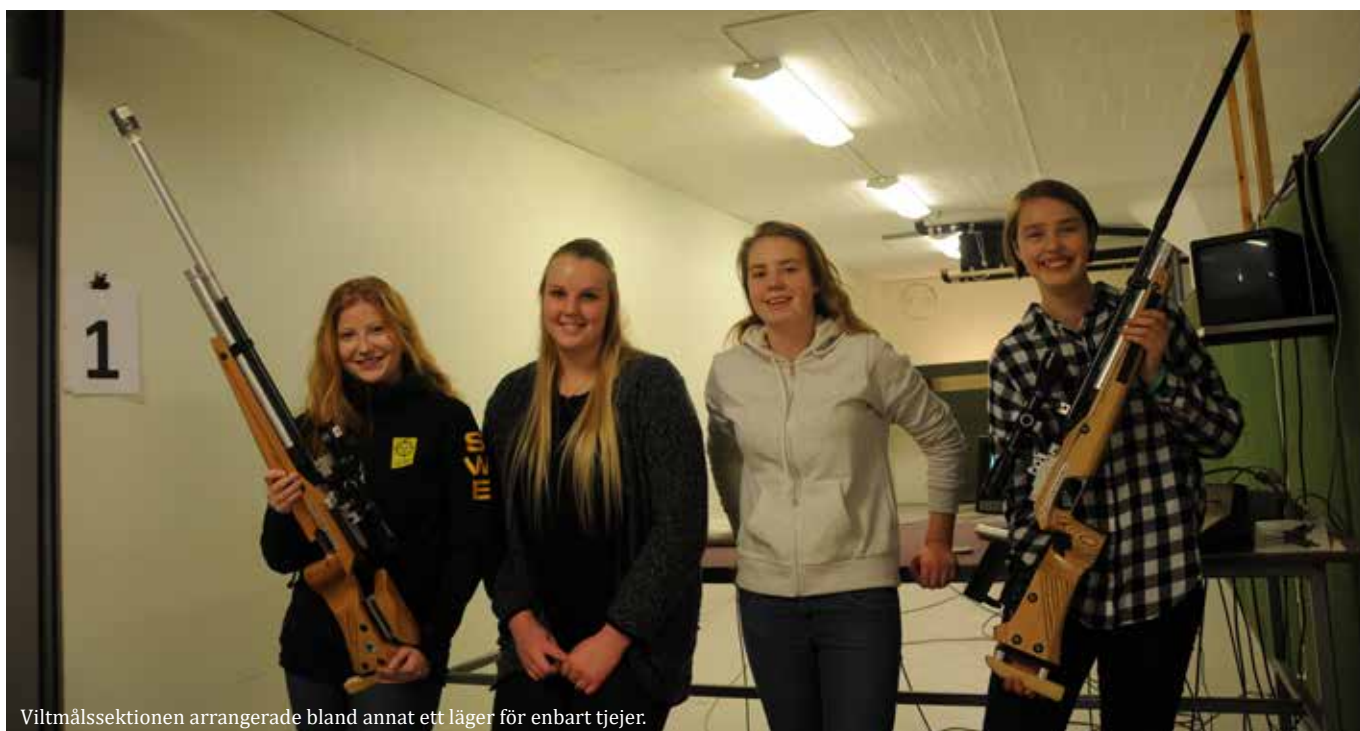
Viltmålssektionen arrangerade bland annat ett läger för enbart tjejer.