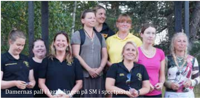
Damernas pall i lagförelingen på SM i sportpistol.