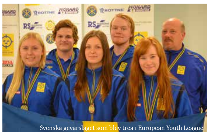
Svenska gevärslaget som blev trea i European Youth League