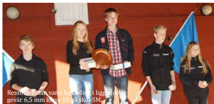
Renforsskolan vann lagtävling i liggande gevär 6,5 mm klass 15 på skol-SM.