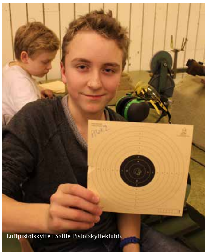
Luftpistolsskytte i Säffle Pistolsskytteklubb.

Verksamheten har i allt väsentligt genomförts enligt plan och sektionen har i huvudsak uppnått de mål som fastställdes i 2015 års verksamhetsplan. Målet att erövra medaljer på EM 25/50 m nåddes inte men målet att bygga upp regionala träningsgrupper över landet har däremot slagit väl ut. I slutet av året var hela fem regionala träningsgrupper etablerade, från Norrbotten i norr till Skåne i söder. Pistolsektionen kan också konstatera att även målet att skyttarna skulle vinna ytterligare rutin och kunskaper för skytte i världsklass infriades genom ett brett deltagande i internationella tävlingar.