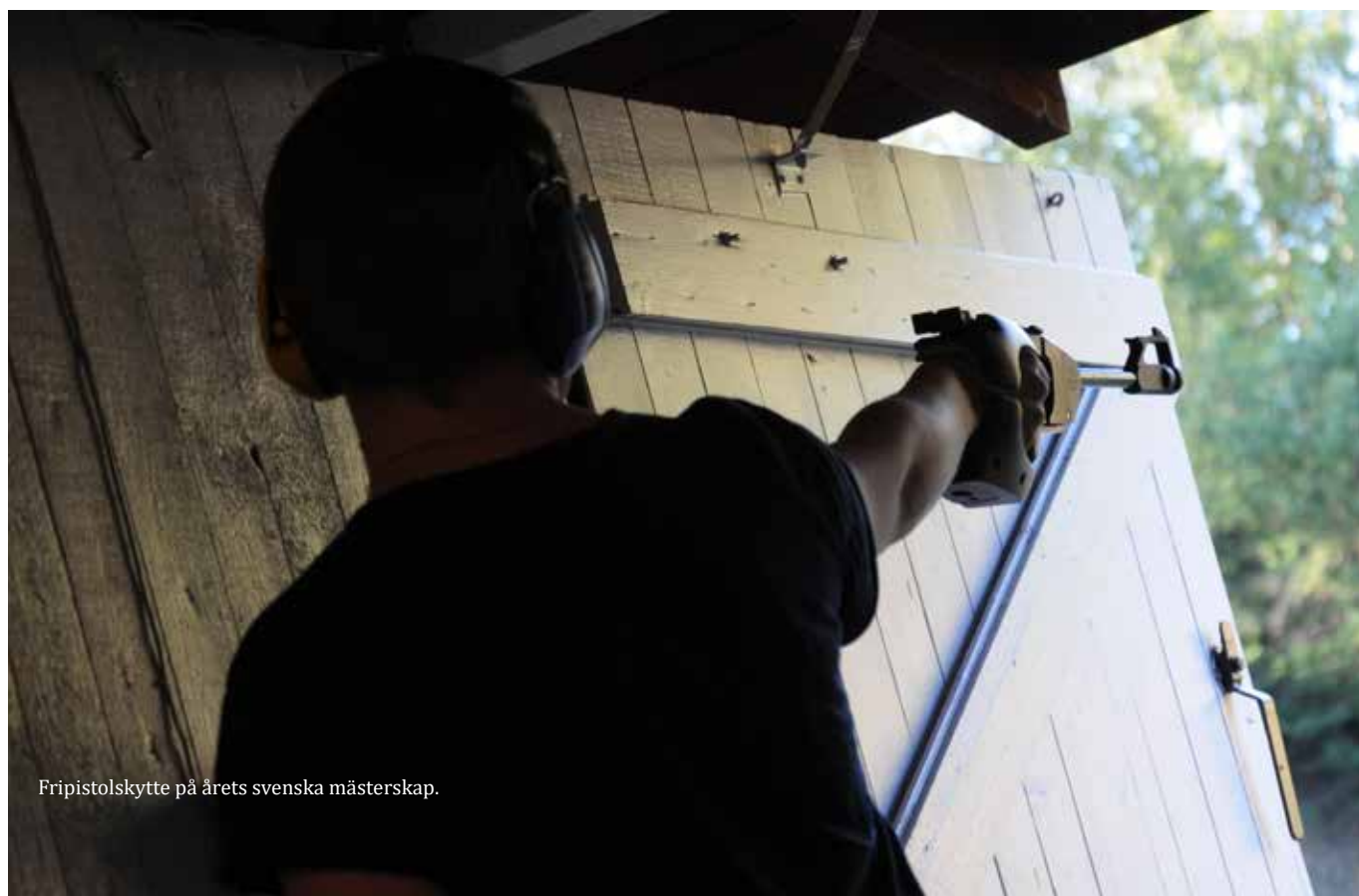
Fripistolsskytte på årets svenska mästerskap.