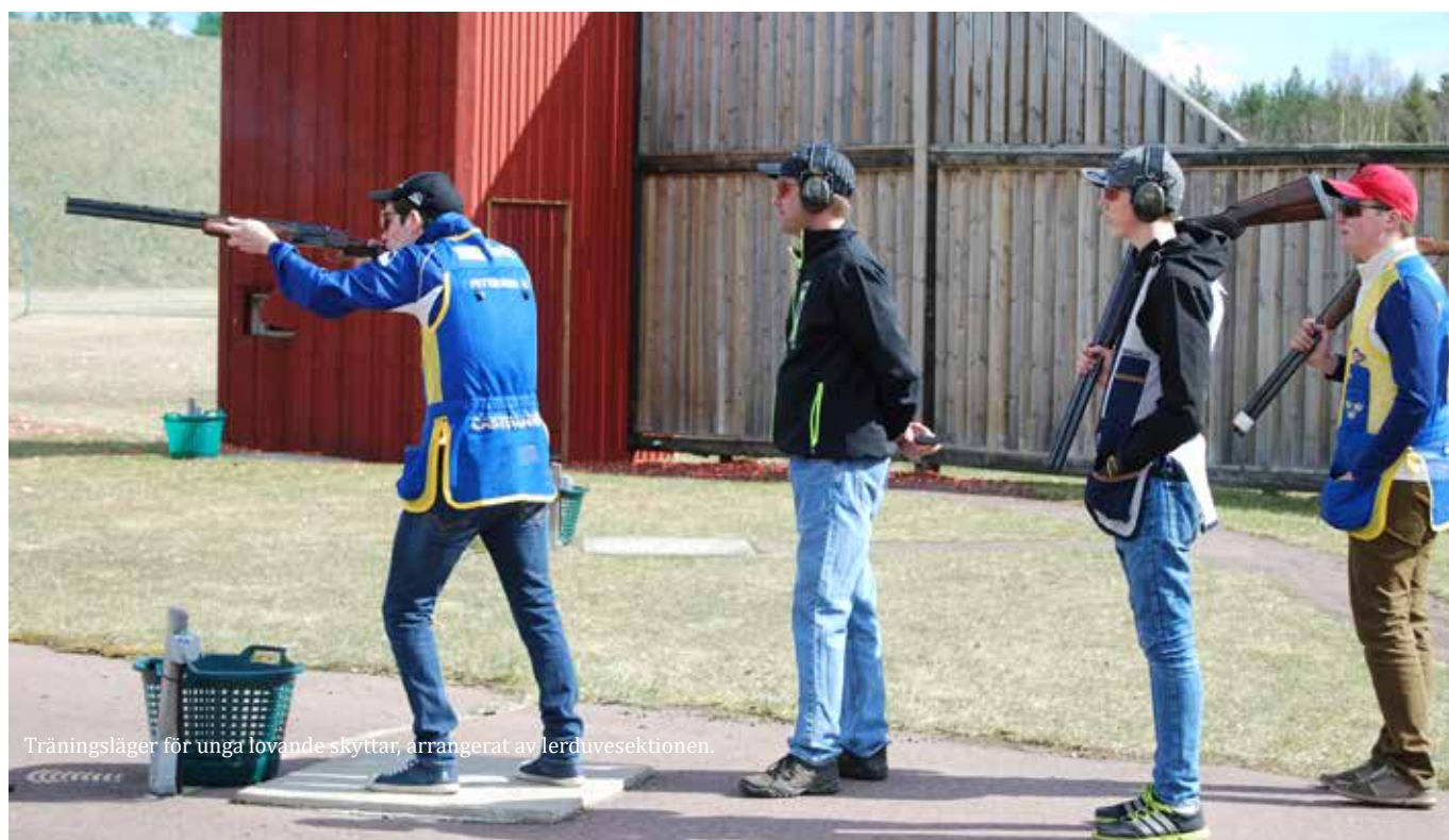
Träningsläger för unga lovande skyttar, arrangerat av lerdüvesektionen.