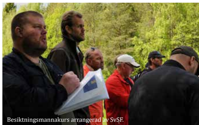
Besiktningmannakurs arrangerad av SvSF.