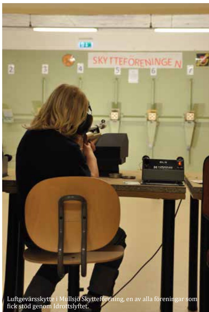
Luftgevärsskytte i Mullsjö Skytteförening, en av alla föreningar som fick stöd genom Idrottslyftet.