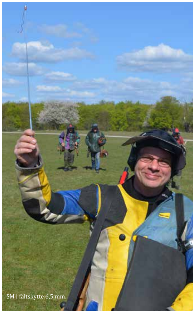
SM i fältskytte 6,5 mm.