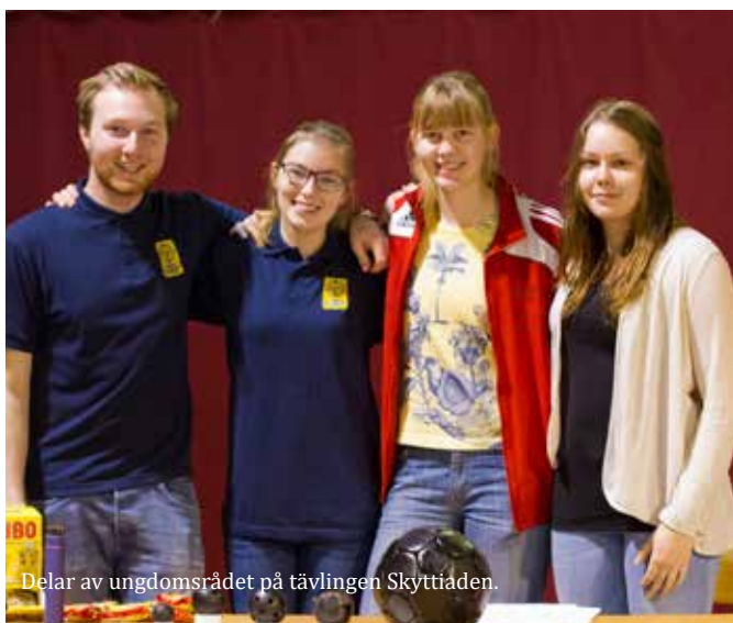
Delar av ungdomsrådet på tävlingen Skyttiaden.

Till förbundets årsmöte samt skytteforum har ungdomar bjudits in från alla distrikt. Under båda evenemangen så har ungdomsrådet tagit upp Riksidrottsförbundets nya riktlinjer för barn och ungdomar. I samband med skytteforum så genomförde rådet en lyckad helg med de ungd-