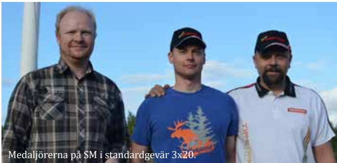
Medaljörerna på SM i standardgevär 3x20.