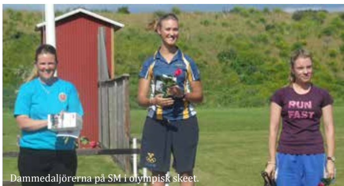
Dammedaljörerna på SM i olympisk skeet.