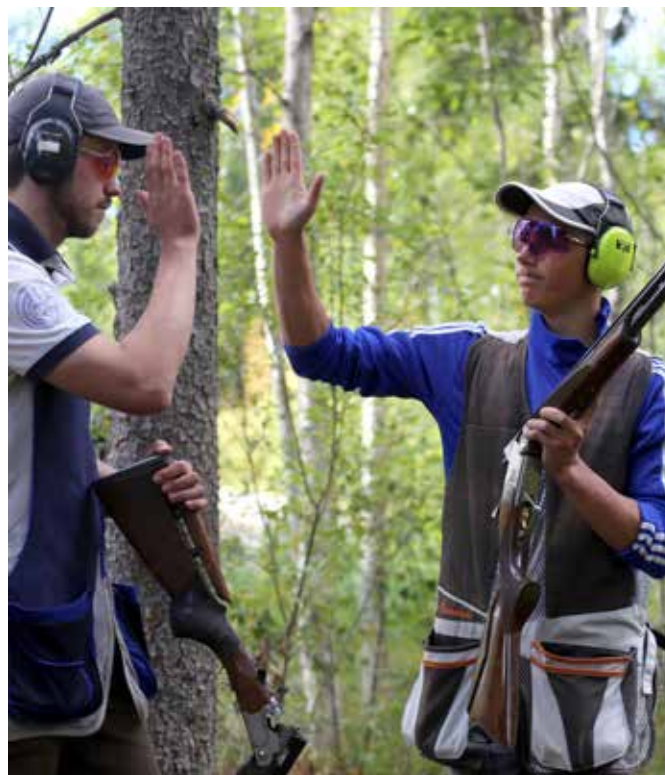
High five på SM i Fitasc Sporting.