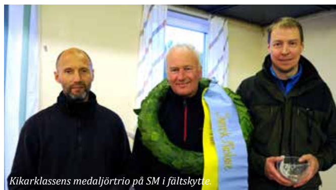
Kikarklassens medaljtrio på SM i fältskytte.