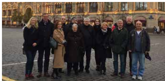
Svensk representation på mötet för ESC:s tekniska kommitté.