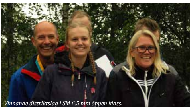
Vinnande distriktslag i SM 6,5 mm öppen klass.