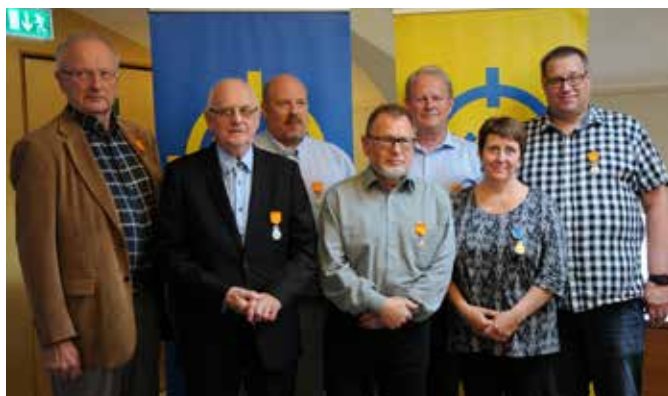
Förtjänstteckenmottagarna som närvarade på SvSF:s årsmöte.