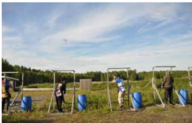
Med hjälp av Idrottslyftet kunde Sunderbyn Sport & JSK utöka sin ungdomsverksamhet.

på Grand Prix-tävlingar eller motsvarande för att få tävlingsvana (deltagande i EM eller VM har inte finansierats av dessa medel).