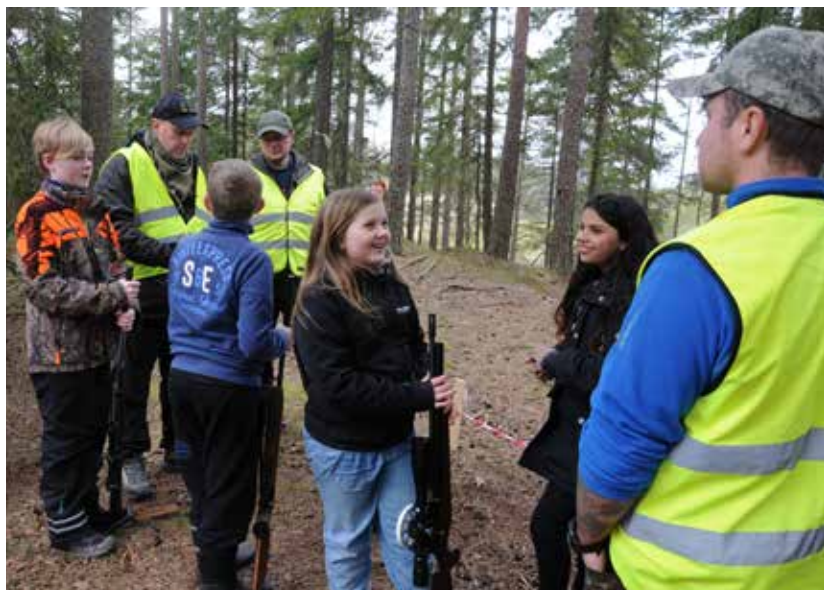
Skepplanda Skytteförening kunde utveckla sin barn- och ungdomsverksamhet med hjälp av Idrottslyftet. Här arrangerar man en field target-tävling för bara unga skyttar.