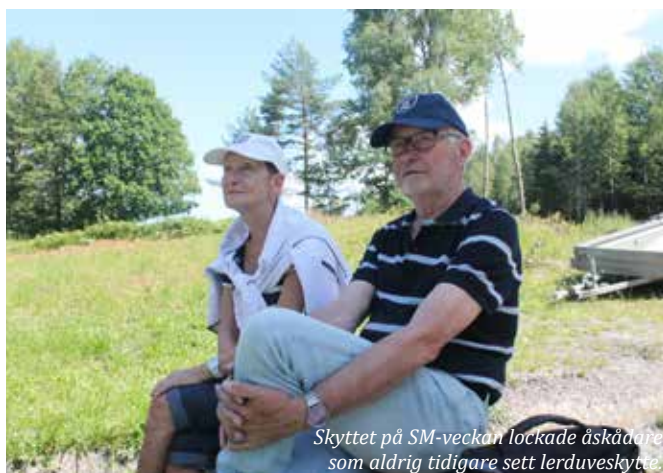
Skyttet på SM-veckan lockade åskådare som aldrig tidigare sett lerduveskytte.