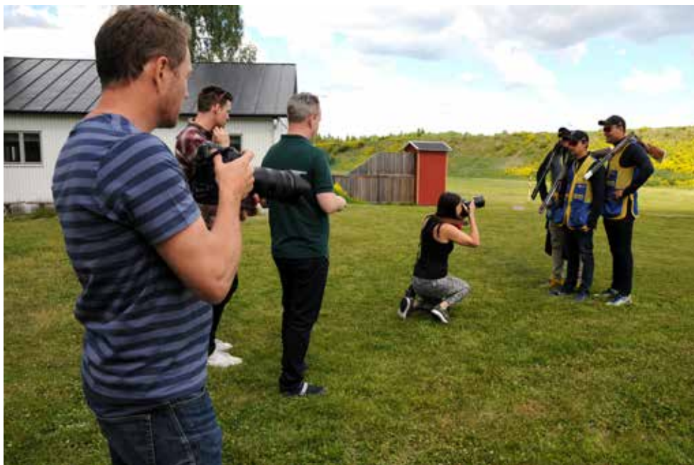
Stort medialt intresse för de svenska OS-skyttarna när SvSF bjöd in till pressträff.

heter Multi testa, vilket innebär att det är runt 60 barn per vecka som prövar olika typer av sporter, däribland skytte. Skytte är även en aktivitet för 110 barn per vecka som åker på day campet. Rådet stöttade även upp evenemanget genom att medverka som ledare för skyttesporten.