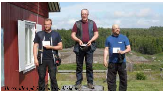
Herrpallen på SM i nationell skeet.