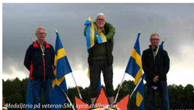
Medaljtrio på veteran-SM i kpist ställningar.