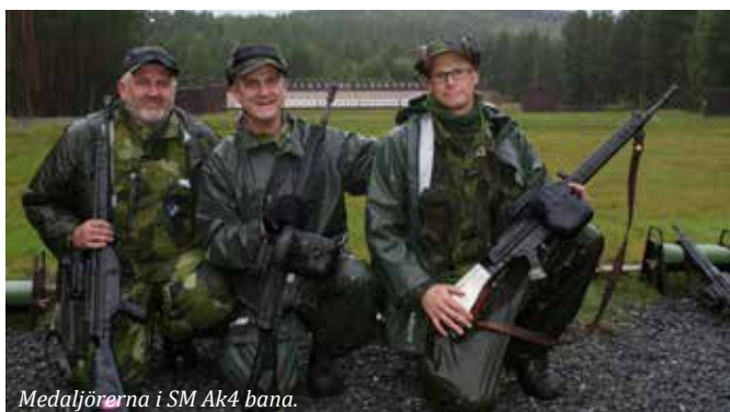
Medaljörerna i SM Ak4 bana.