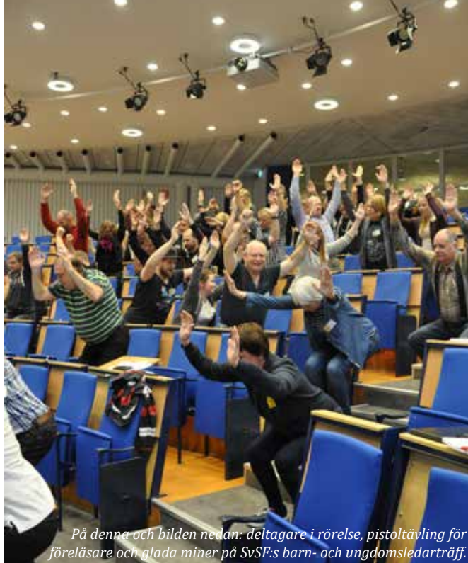
På denna och bilden nedan: deltagare i rörelse, pistoltävling för föreläsare och glada miner på SvSF:s barn- och ungdomsledarträff.