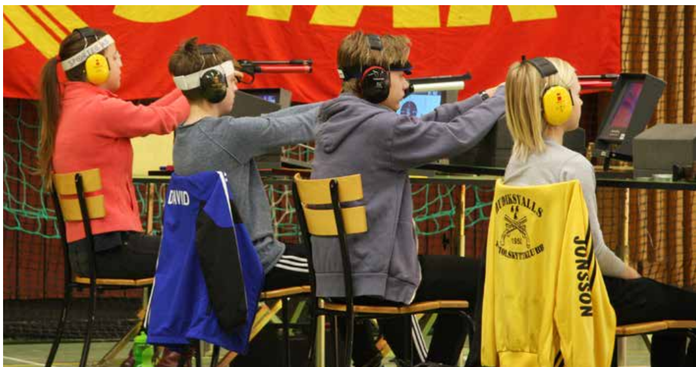
Riksfinal i Svenska Ungdomscupen.