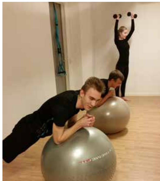
Eskilstuna Skytteförening fick Idrottslyftstöd för att satsa på fysisk träning.