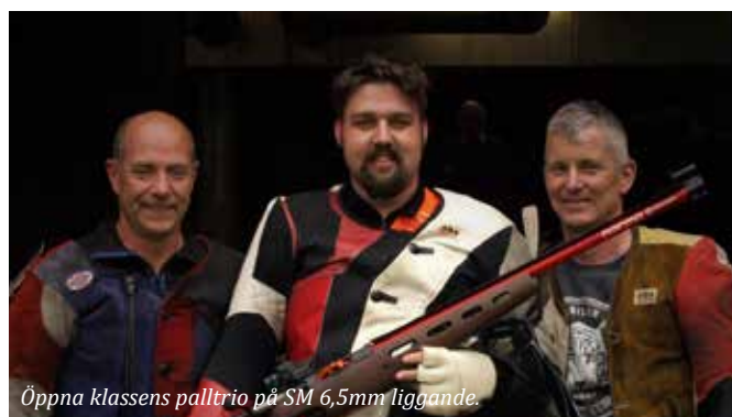
Öppna klassens palltrio på SM 6,5mm liggande.