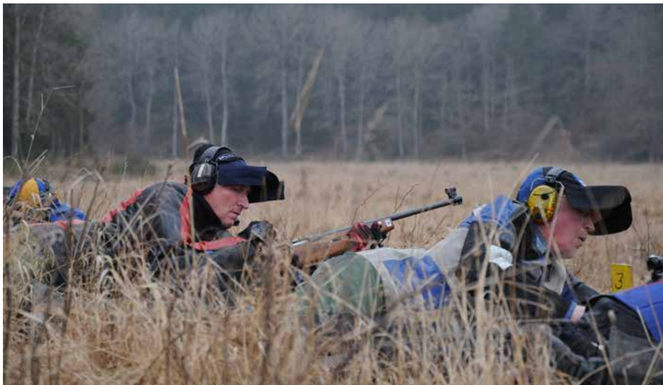
Fullt fokus på fältskytte-SM 2016.