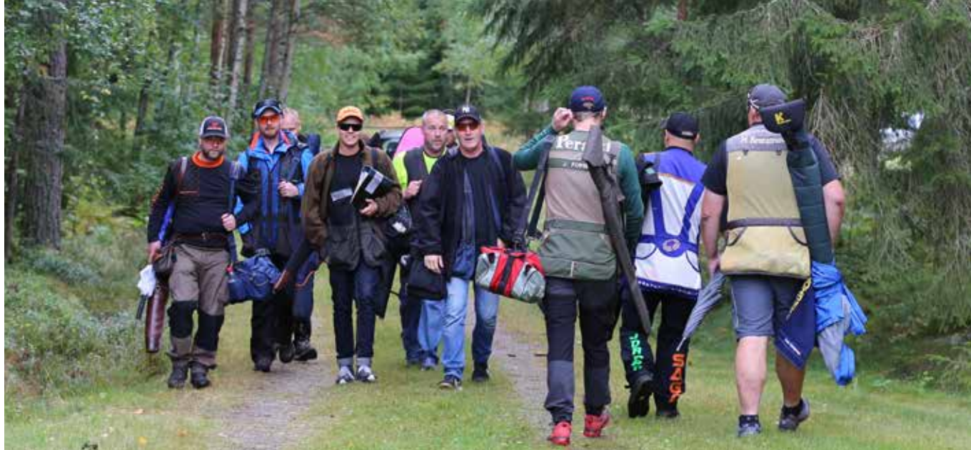
Stationsbyte på SM i Fitasc Sporting.