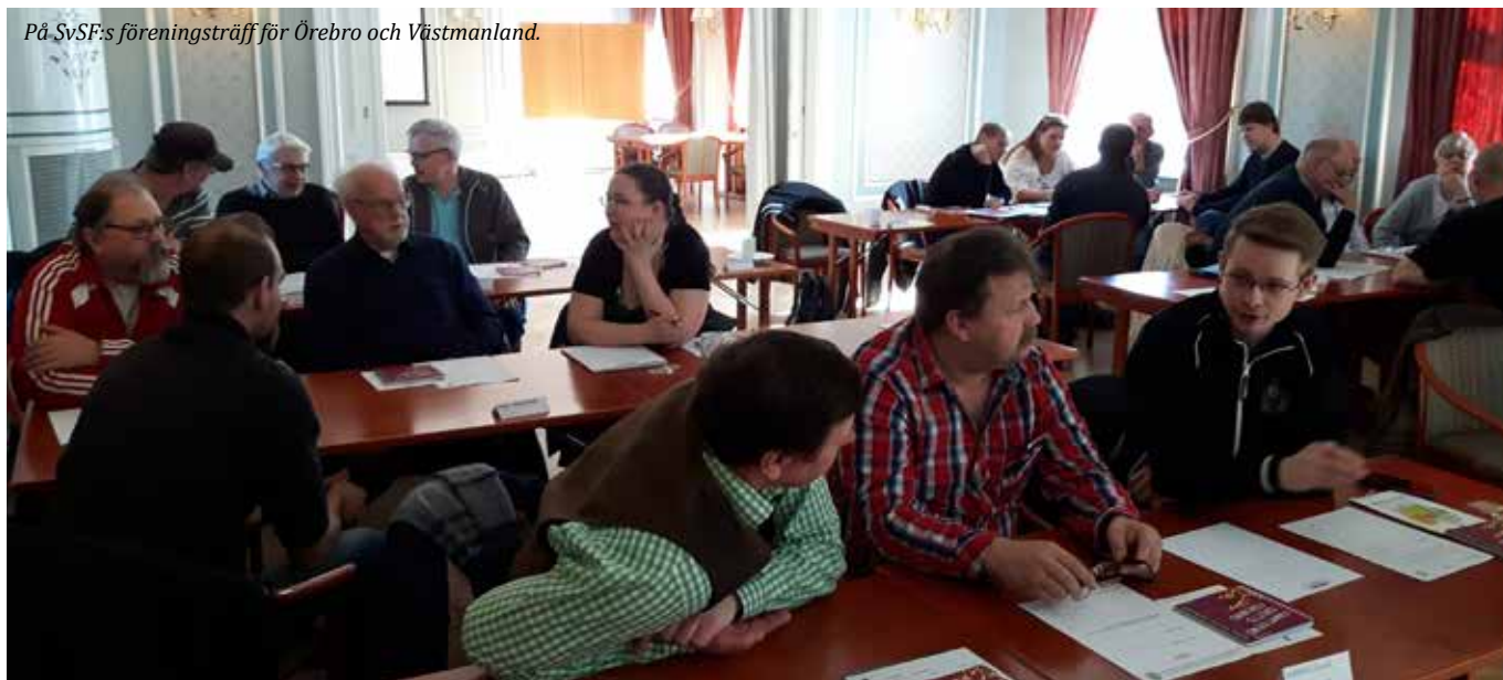
På SvSF:s föreningsträff för Örebro och Västmanland.

Genom att se till att det finns många och utbildade ledare/tränare skapar vi en attraktiv och trygg miljö. Om medlemmarna blir sedda, utvecklas och kan påverka verksamheten stannar de längre i idrotten. Vi ser också att utbildade ledare/tränare vet när en person vill satsa mer på sitt skytte och kan hjälpa denna att ta nästa steg i utvecklingen.