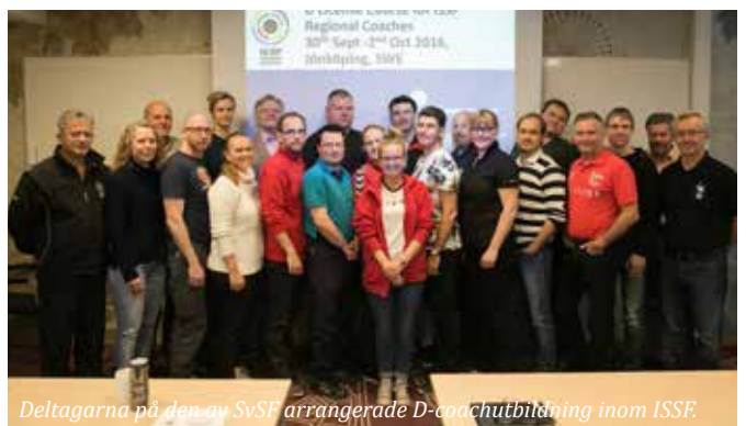
Deltagarna på den av SvSF arrangerade D-coachutbildning inom ISSF.

ningsnivå kan lägga upp tävlingar och evenemang. Systemet kan användas för anmälan till tävling och till anmälan kan även en betalfunktion kopplas på. I systemet går det nu att köpa tävlingslicenser och betala skyttekortsprov. Kvar att utveckla är delarna kring klassificering, ranking och serier och detta arbete är planerat att genomföras under första halvan av 2017.