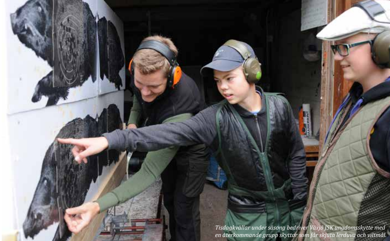
Tisdagkvällar under säsong bedriver Växjö JSK ungdomsskytte med en återkommande grupp skyttar som får skjuta lerduva och viltmål.

ten och kontakten inom distriktet, men även diskutera kring föreningarnas egen verksamhet. Resterande tid av träffen ägnas åt information och frågor om till exempel Idrottslyftet, utbildningssatsningen, SäkB, organisationsfrågor, anläggningsbidrag, tävlingskalendern samt SvSF som frivillig försvarsorganisation.