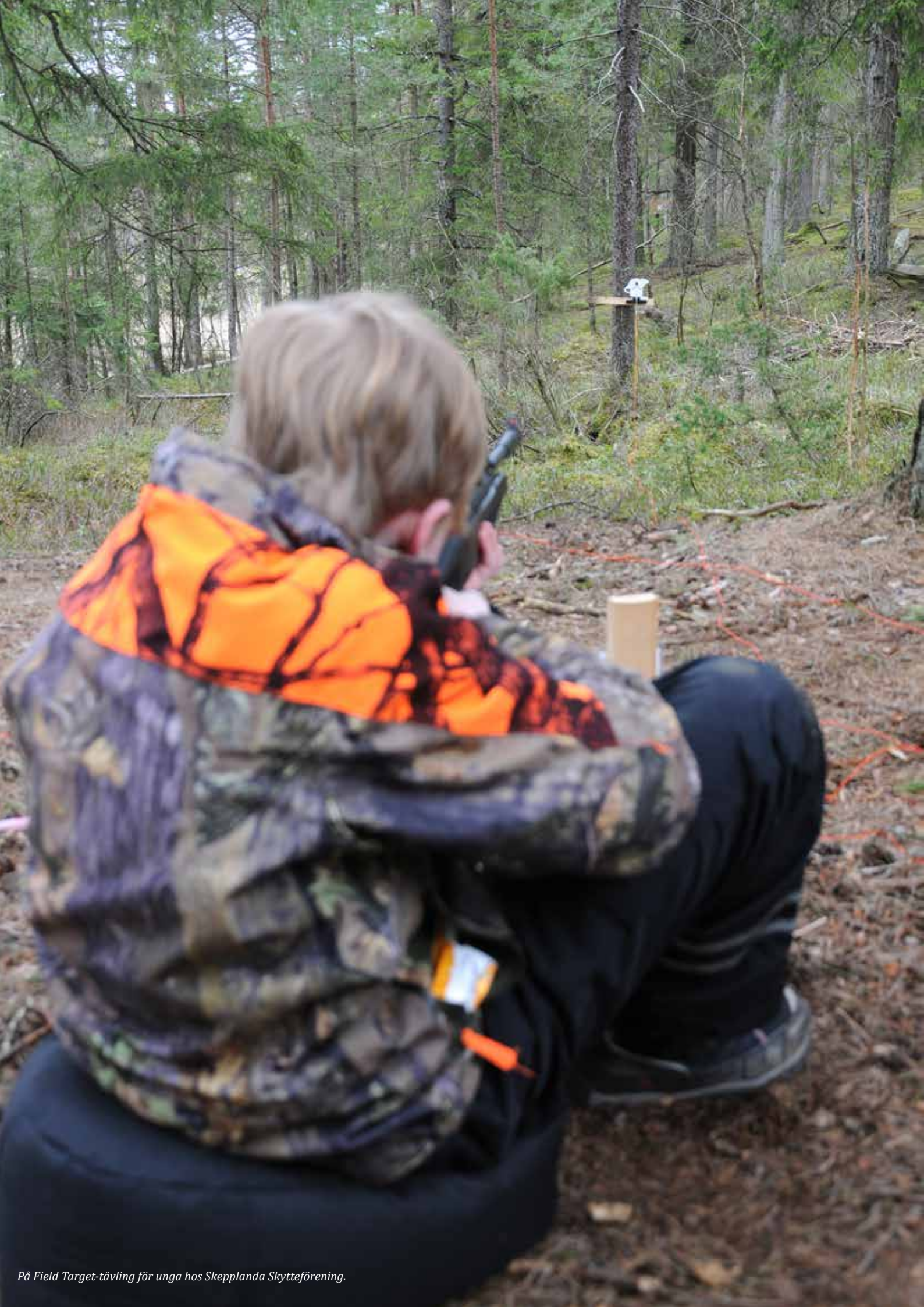
På Field Target-tävling för unga hos Skepplanda Skytteförening.