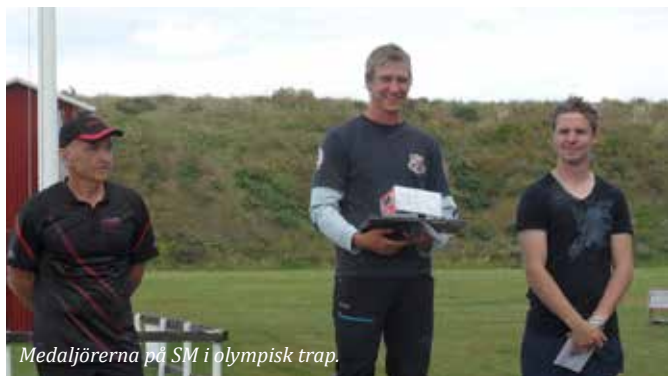
Medaljörerna på SM i olympisk trap.