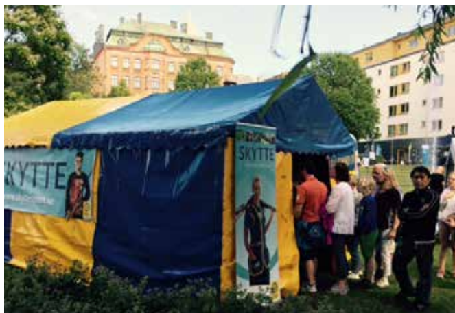
Kön till prova på-skyttet var lång under SM-veckan i Norrköping.