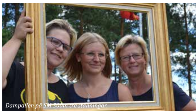
Dampallen på SM 300m tre ställningar.

Banskjutning: 184 individuellt, 59 kompanilag, 14 bataljonslag