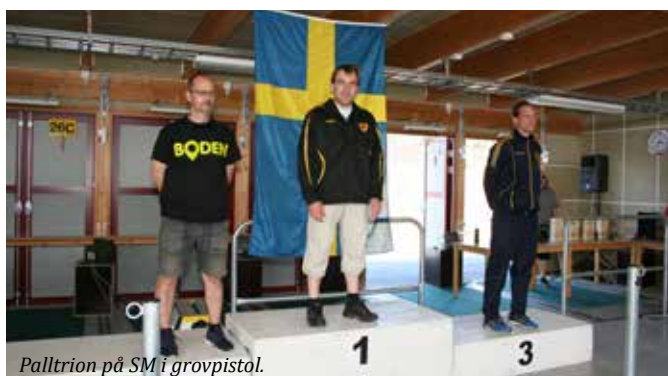
Palltrion på SM i grovpistol.