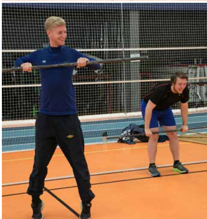
Elitskyttar rörelsetestas på läger på Bosön.

Under hösten genomförde vi tillsammans med ISSF en D-coachutbildning i Jönköping som ett steg i att stärka vår nationella tränarkompetens på föreningsnivå. Läs mer under Utbildning.