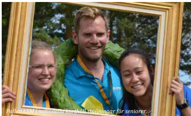
Pallen i SM i nationella korthåll ställningar för seniorer.