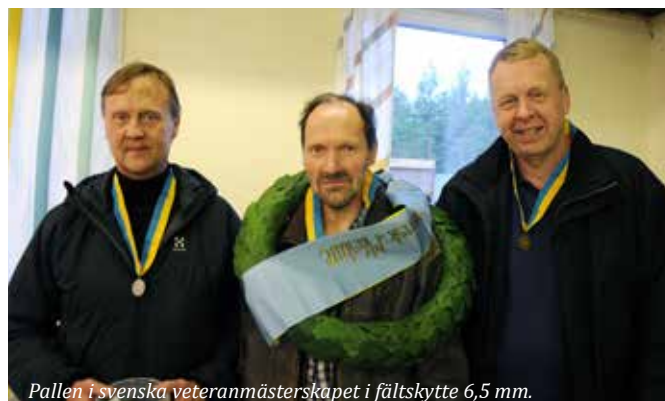
Pallen i svenska veteranmästerskapet i fältskytte 6,5 mm.