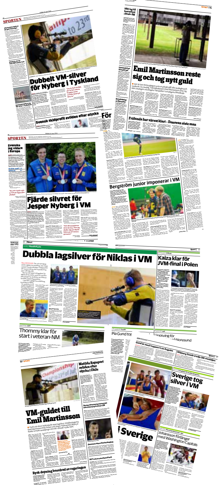
Viltmåls-VM, med SvSF:s bilder, i media. Faksimil av tidningssidor i Hallandsposten, Smålandsposten, Värmlands Folkblad, Arvika Nyheter och Nya Wermlands Tidning.

SvSF har under året fortsatt att jobba aktivt med vissa sociala medier, med målsättningen att ge en positiv bild av skyttesporten och skapa ett mervärde, samt sprida information till såväl skyttar som ickeskyttar. Vi vill helt enkelt ta chansen att synas lite extra genom att finnas där folket redan är.