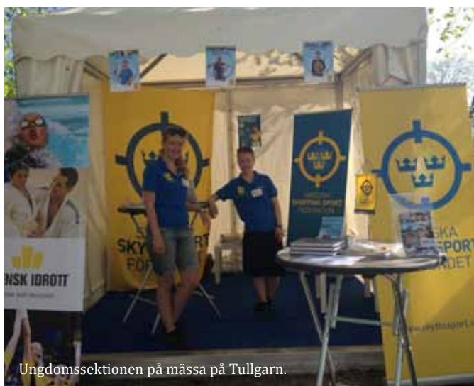
Ungdomssektionen på mässa på Tullgarn.