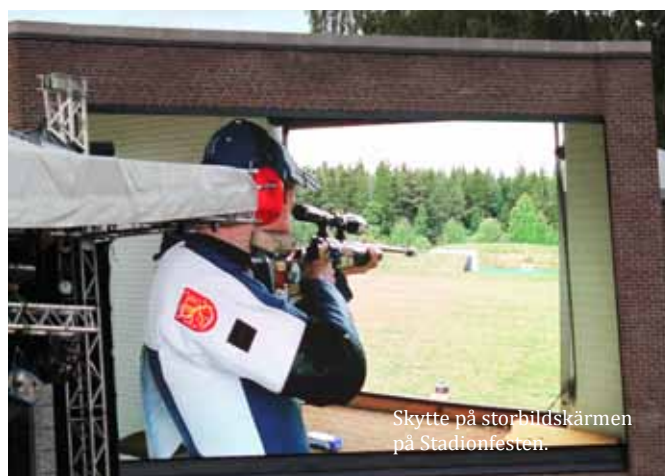
Skytte på storbildsskärmen på Stadionfesten.

förberedelserna. Tack vare det stora engagemanget från alla inblandade blev VM en arrangörsmässig framgång och förhoppningsvis ett steg på vägen tillbaka till OS. Sverige slutade på en åttondeplats i medaljligan med två individuella silver och ett lagsilver. Glädjande nog gav VM-evenemanget också ett litet ekonomiskt överskott.