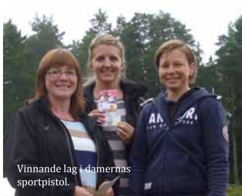
Vinnande lag i damernas sportpistol.