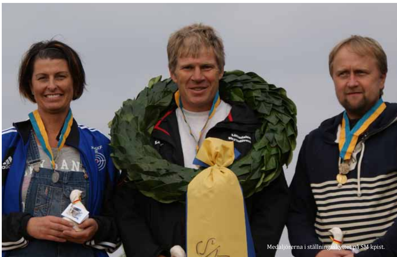
Medaljörerna i ställningsskyttet på SM kpist.