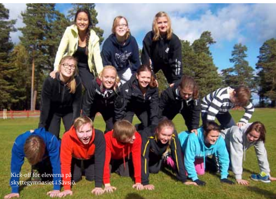
Kick-off för eleverna på skyttegymnasiet i Sävsjö.

Tidningen Svensk Skyttesport genomgick inför år 2012