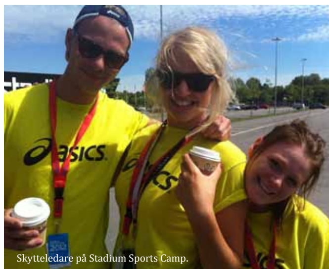
Skytteledare på Stadium Sports Camp.

Ungdomssektionen har gett ekonomiska bidrag till lägerverksamhet samt resor som uppmuntrar ungdomar till att tävla internationellt i grenöverskridande grupper.