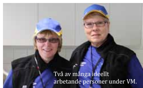
Två av många ideellt arbetande personer under VM.