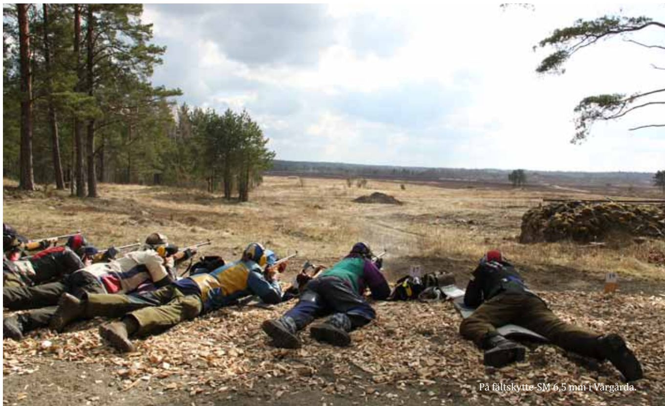
På fältskytte-SM 6,5 mm i Vårgårda.