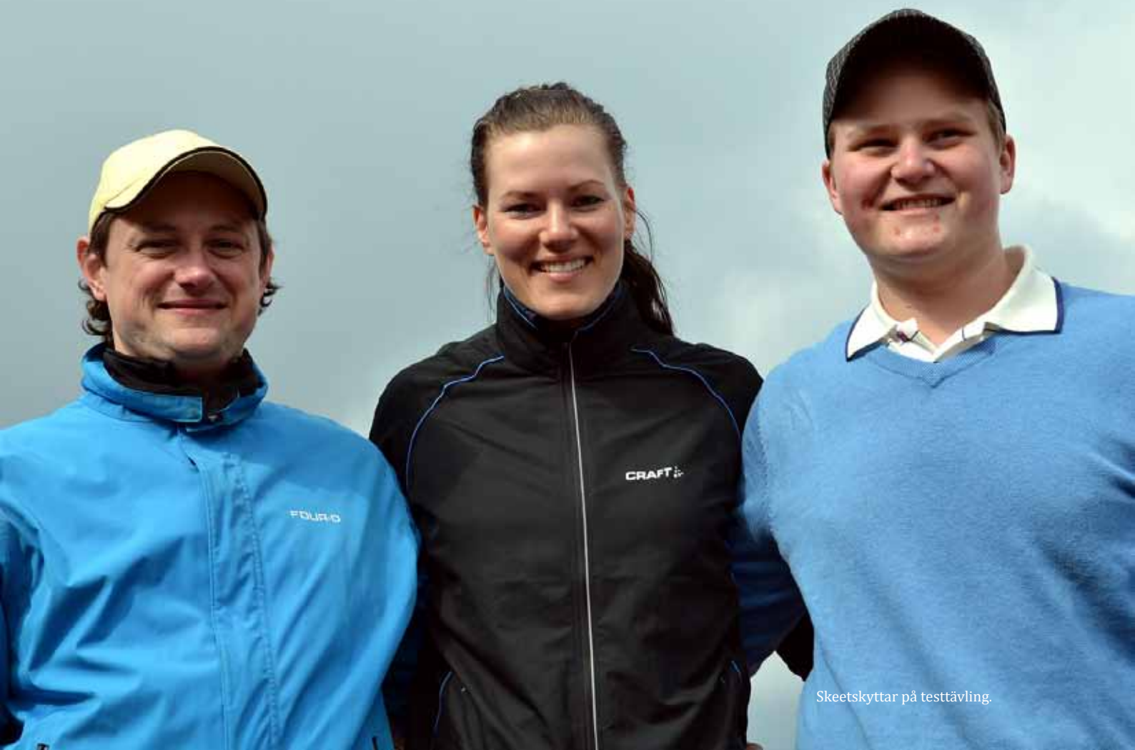
Skeetskyttar på testtävling.