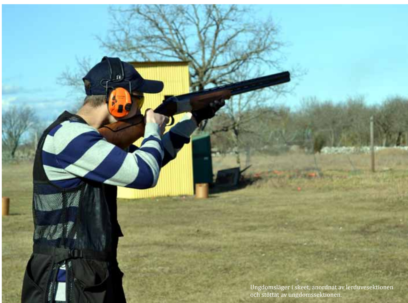
Ungdomsläger i skeet, anordnat av lerduvesektionen och stöttat av ungdomssektionen.