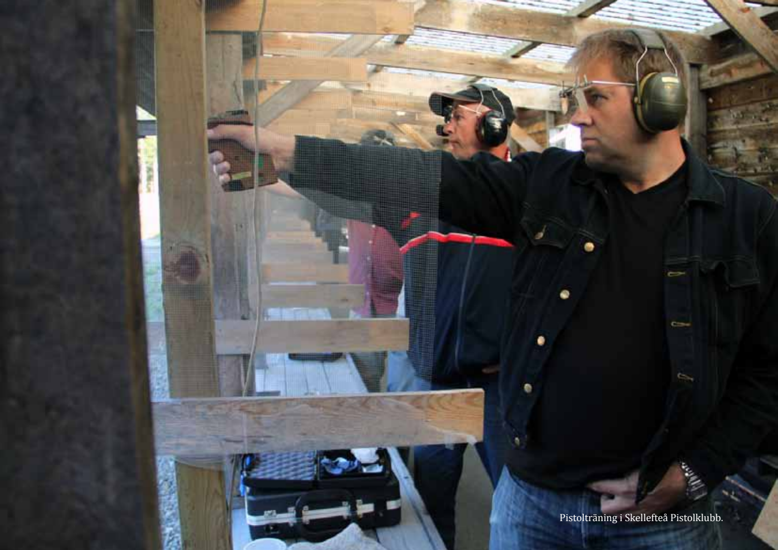
Pistolträning i Skellefteå Pistolklubb.