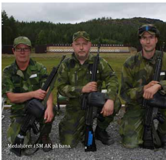
Medaljörer i SM AK på bana.