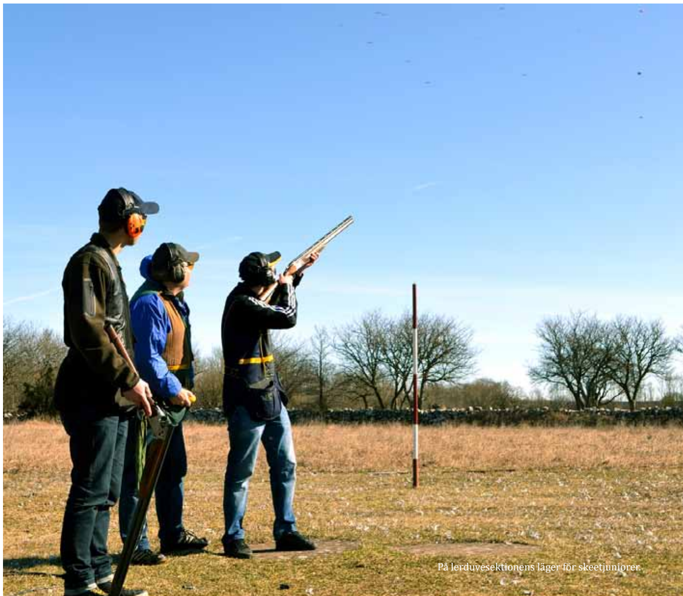
På lerduvesektionenens läger för skeetjuniorer.