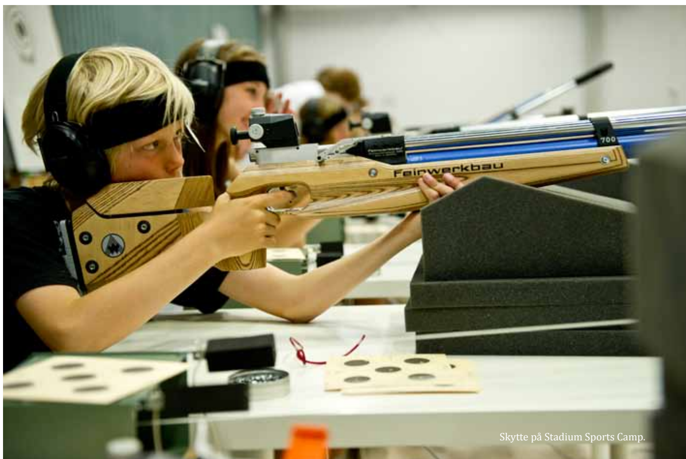
Skytte på Stadium Sports Camp.