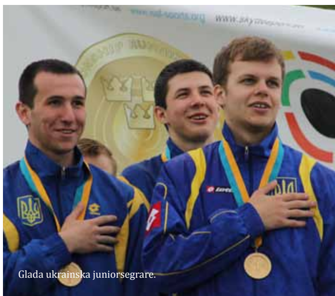
Glada ukrainska juniorsegrare.