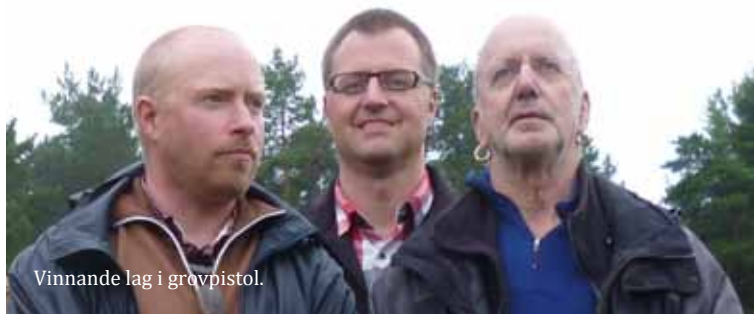
Vinnande lag i grovpistol.