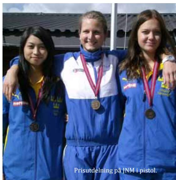
Prisutdelning på JNM i pistol.