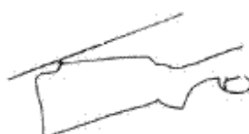
Monte Carlo stock